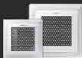
Wind-Free™ 4-smerna kasetna

Na voljo v serijah Multi Split, Commercial in VRF.